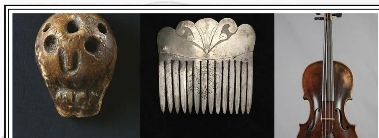
De resandes kulturarv