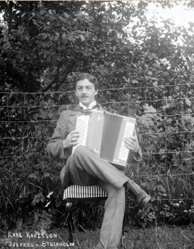
KARL KARLSSON JULARBO - STOCKHOLM