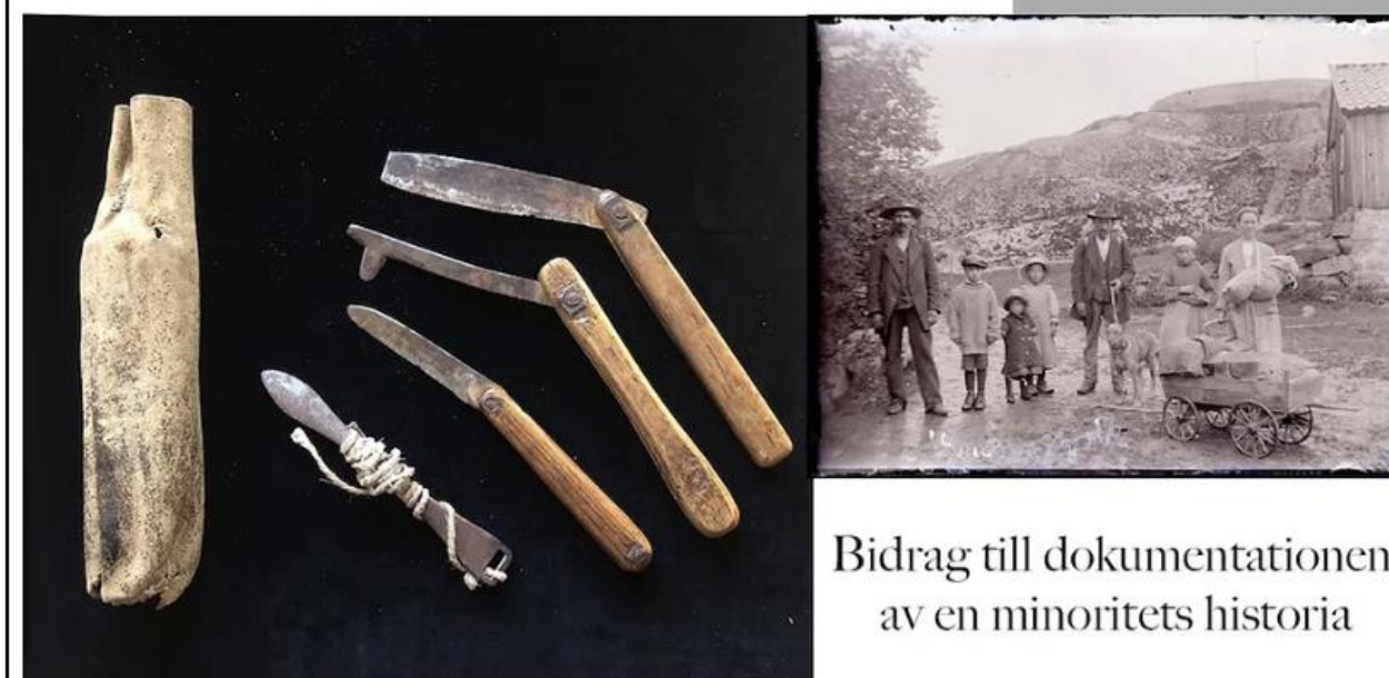
Bidrag till dokumentationen av en minoritets historia